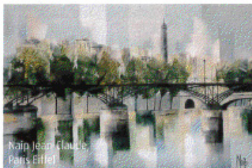
Nain Jean Claude Paris Eiffel