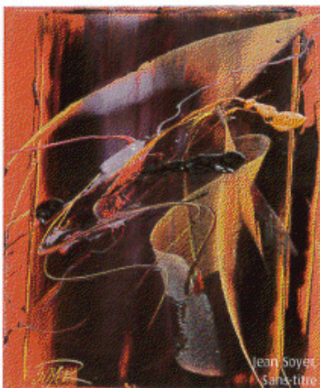
Jean Soyer Sans titre