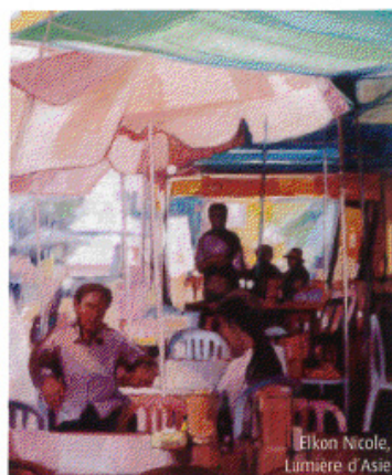
Elkon Nicole Lumière d'Asie

La nouvelle équipe des Artistes du Val-de-Marne souhaite mettre à la disposition des exposants et des sociétaires bénévoles l'outil informatique pour simplifier l'organisation et la gestion du salon. Elle crée un logo en 2008 pour en assurer l'image.